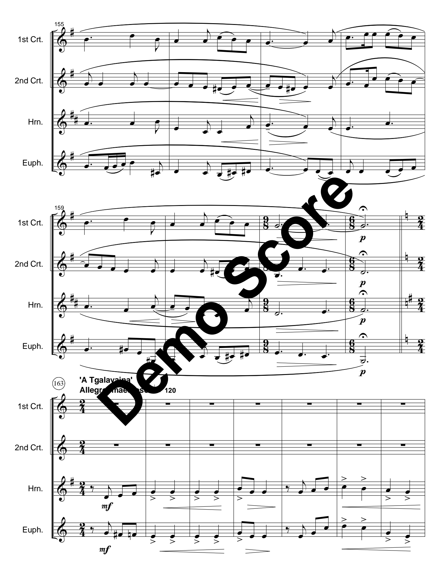
Fantasietta - LME 217