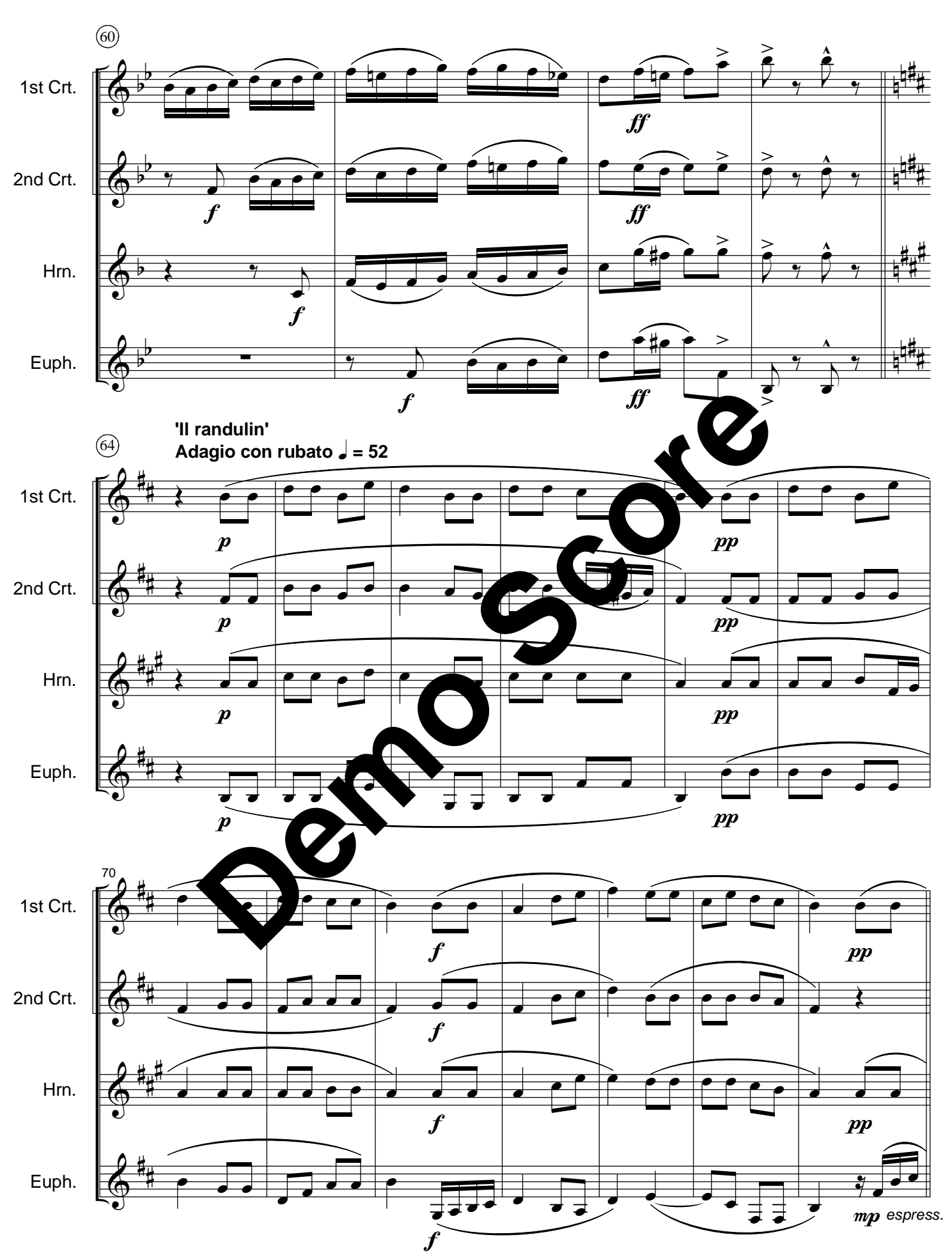
Fantasietta - LME 217